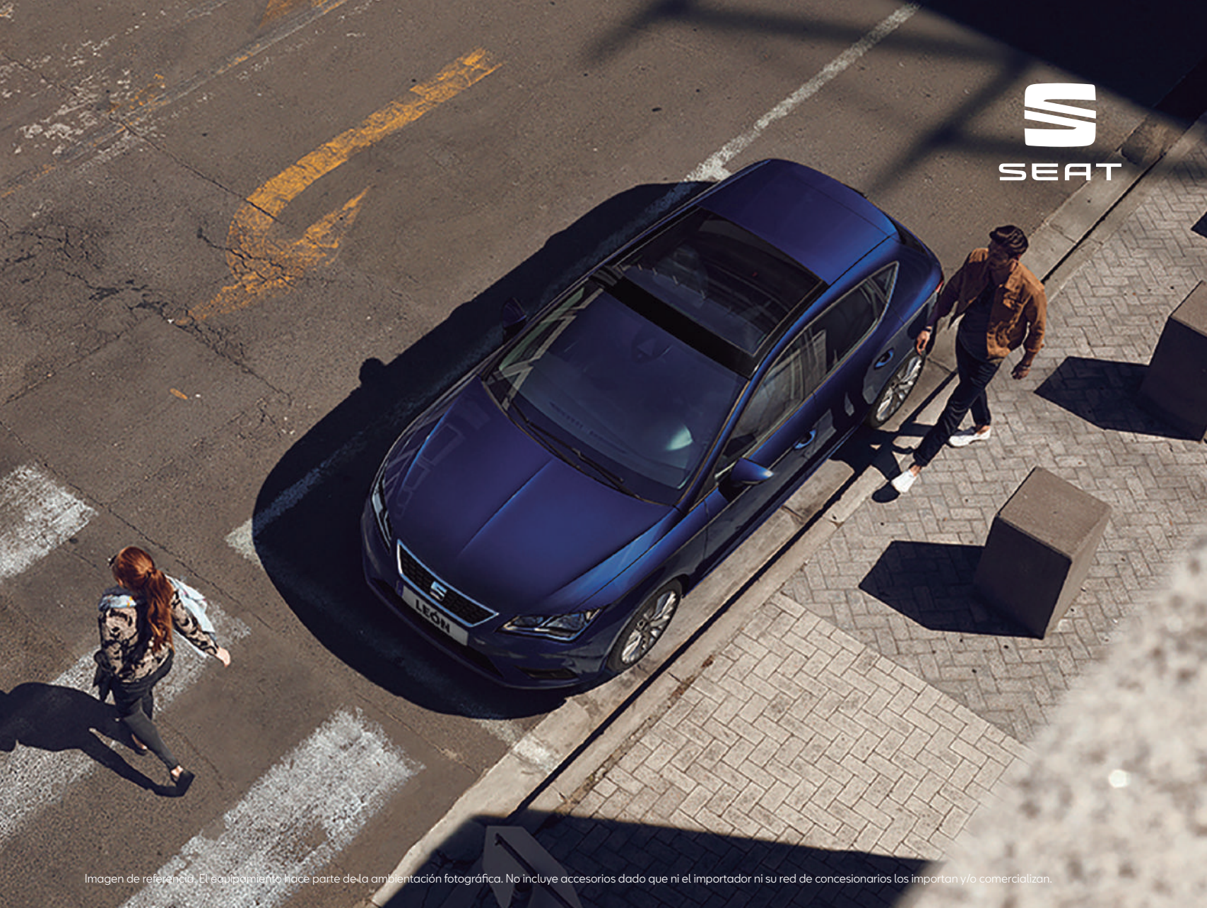
Imagen de referencia. El equipamiento hace parte de la ambientación fotográfica. No incluye accesorios dado que ni el importador ni su red de concesionarios los importan y/o comercializan.